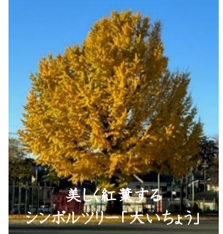
美しく紅葉する シンボルツリー「大いちょう」

本年も残り12月のみとなり、校庭のシンボルツリー「大いちょう」は遅い秋の訪れとともに、今、美しく紅葉しています。