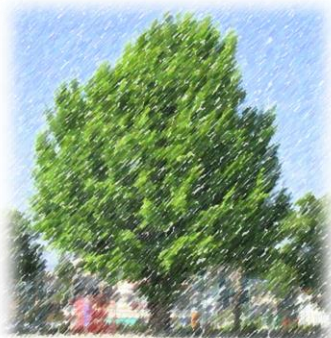
シンボルツリー 「大いちょう」

また、本日は子供たちが学校生活を送る上でとっても大切な1日でした。久しぶりに登校した子供たちは、心も体も一回り大きくなっていました。目をキラキラと輝かせて、新しいクラスの仲間と大切な1日を真剣に過ごしていました。きっと新たな学年・学級での出会い、目標、決意をもって登校したことからでしょう。保護者の皆様におかれましても、お子様の新しい学校生活に向けて、期待と不安をお持ちのことと思います。このような子供たちの想いと保護者の皆様のお気持ちをしっかりと受け止め、子供たち一人一人の心のエネルギーが醸成できる学校生活となるよう、尽力してまいります。温かなご支援、ご協力をお願ひいたします。