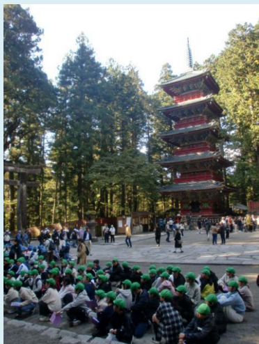
五重の塔（日光東照宮）

先月10月22日に小手指小学校は136歳の誕生日を迎えました。本校は明治22年（1889年）に開校以来、明治、大正、昭和、平成、令和と5代にわたり激動の時代を途切れることなく、連綿と教育活動を続けてきました。いったい何人の教師が教壇に立ち、何人の子供たちと時を過ごしたのでしょうか。その長い年月の中で教師と子供、また子供たち同士の関わり合いがあり、学びの中での驚きや喜びがあり、笑って、泣いて、喧嘩をして仲直りをして・・・という子供たち同士の心と心のやり取りが無数に積み重なって今の小手指小学校があるのだなあ、と考えると胸が熱くなる思いです。また、現在、子供たちがのびのびと健やかに学校で学べているのは、開校以来、学校の教育活動を支えてくださっている保護者の皆様、地域の皆様の絶え間ないご支援・ご協力に他ならないと思います。本当