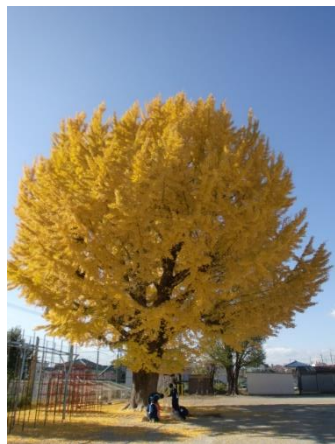
黄葉が深まる大いちょう 12/16に剪定作業が入ります